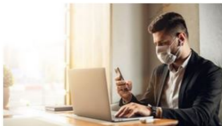
Coronavirus – Arbeit Was sollte ich wissen?