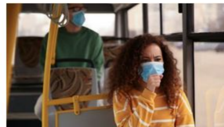
Coronavirus – Öffentliches Leben und Mobilität Was sollte ich wissen?